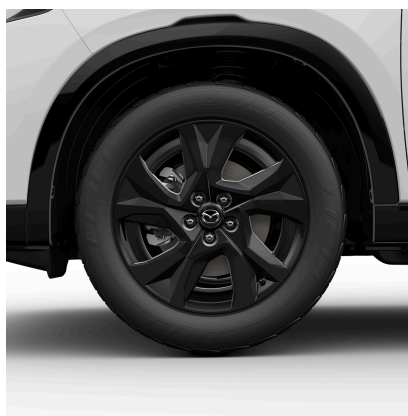
HLINÍKOVÁ KOLA BARVA: ČERNÁ METALÍZA (7G1) - 270 TRE 225/55R19 99V