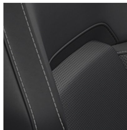
ČERNÉ KOŽENÉ ČALOUNĚN S ELEKTRICKÝM NASTAVENÍM, VYHŘÍVÁNÍM A VENTILOVÁNÍM PŘEDNÍCH SEDADEL (KJN STH)