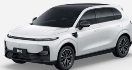
Bílá PEARLY (0AC) 18 000 Kč