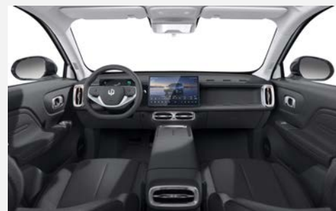
ECO kůže tmavě šedá (OWL)