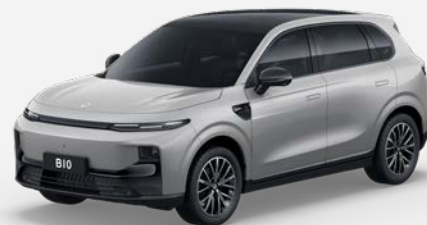
Šedá TUNDRA (0GD) 18 000 Kč