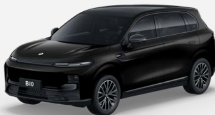
Černá METALLIC (0KL) 18 000 Kč