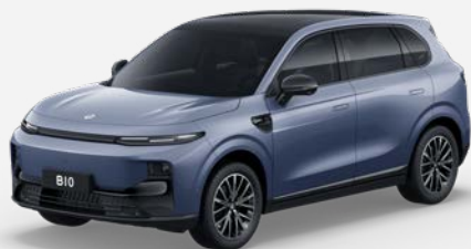
Modrá STARRY NIGHT (0XC) V CENĚ