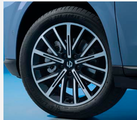
kola z lehkých slitin 18"