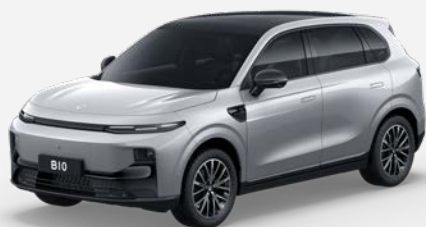
Stříbrná GALAXY (0DS) 18 000 Kč