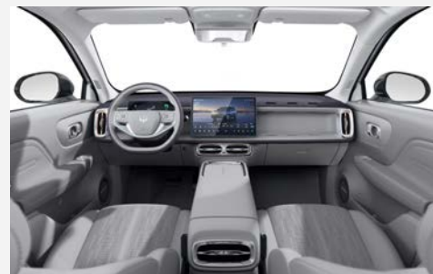
ECO kůže světle šedá (OJS)