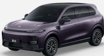
Fialová DAWN (0UB) 18 000 Kč